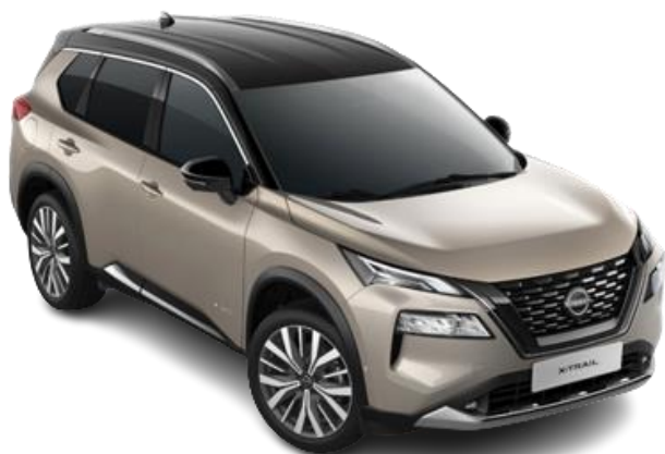
Срібло шампань з чорним дахом – XEW

Двоколірний кузов (основний колір – металік) – 27 120 грн