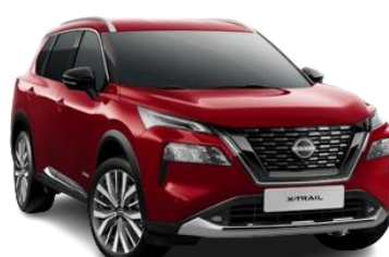
Червоний перламутр - NBL