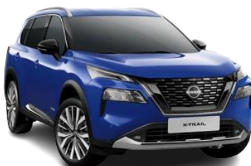
Синій - RBV