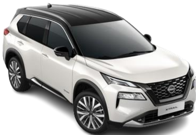
Білий перламутр з чорним дахом – XKJ