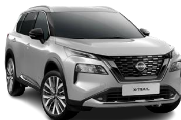
Сріблястий - K23