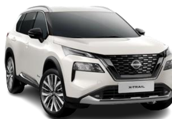
Білий перламутр - QBE