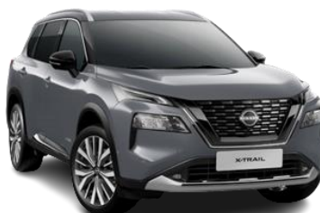
Сірий перламутр - KBV