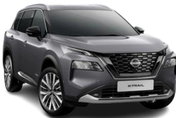
Темно-сірий - KAD