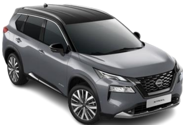
Сірий перламутр з чорним дахом – XEX

Двоколірний кузов (основний колір – преміум/перламутр) – 35 710 грн