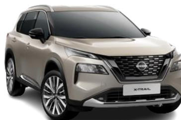
Срібло шампань - KAY