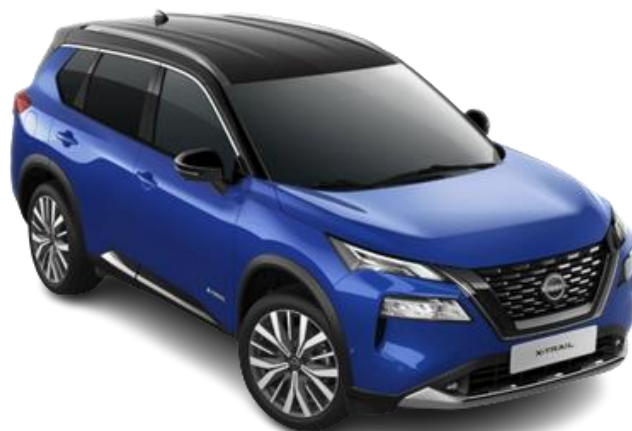
Синій металік з чорним дахом – XEU

Двоколірний кузов (основний колір – преміум/перламутр) – 35 710 грн