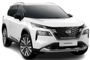
Білий - QAK