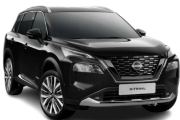
Чорний перламутр - G41